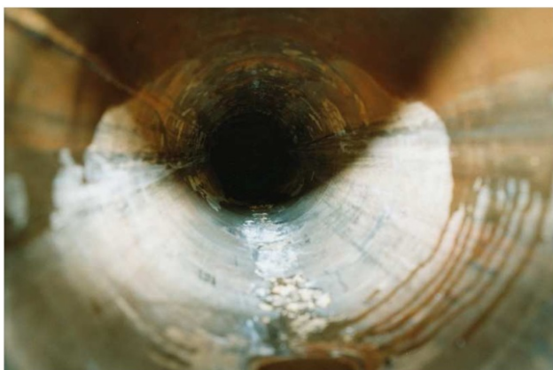
Nádoba, ve které byl namontovaný výměník tepla.