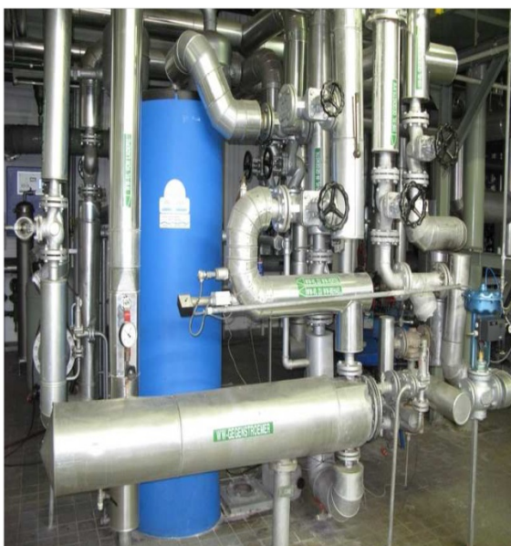
Kotelna s namontovaným změkčovačem vody maiCat® a s výměníkem tepla.

V případě, že teplotní rozdíl mezi vstupem a výstupem je stabilní, znamená to, že na tepelném výměníku se netvoří vodní kámen. Vznik vodního kamene plní funkci izolace, tedy teplotní rozdíl se snižuje, protože proces výměny tepla se přerušuje. Na přání zákazníka byly nastaveny analogové a digitální teploměry, které předávaly parametry do centrálního řídicího panelu kotle.