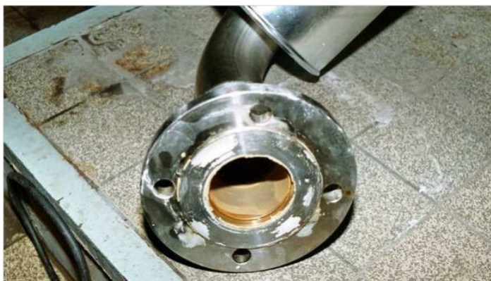
Pohled na vnitřní povrch potrubí z nerezové oceli. Zde si můžete prohlédnout ochranný antikoroziční povlak, který byl vytvořen v důsledku maiCat®.

Je třeba poznamenat, že výměna plniva maiCat® každých 5 let je naše doporučení, nikoli povinnost.